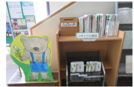
↑リサイクル雑誌コーナー