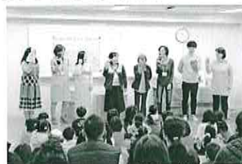
おはなしどんぐり活動の様子

「子どもと本と図書館が好き!」という方、南部図書館と一緒に活動してみませんか。いつでも大歓迎!