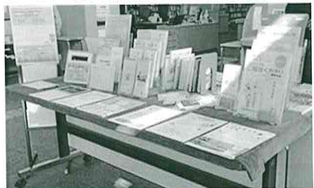
健康推進課と 3 月に行った企画展示の様子

図書館の仕事は、市役所の他部署と関係があり、色々なところで連携・協力して事業を行っています。今後も新たな企画展示を行っていきますので、ご期待ください。