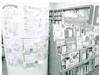
昨年の様子(西部図書館)

夏休み期間、図書館では全館で毎週水曜日を中心に幼児・児童から楽しめる映画の上映やおはなし会を、行います。「こわいおはなし会」や工作、科学あそびなど、小学生の皆さんも楽しめる内容のものもありますよ。