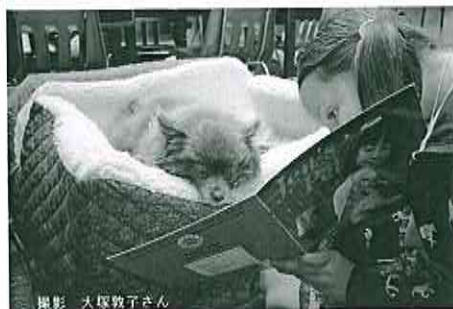
犬の方に本をあげ読んでいる女の子

8月6日(土)午後2時～3時ふれあい教室ほか 対象は、自分で絵本が読める子ども30人。くわしくは、図書館ホームページ、広報みたか、館内ポスターなどお知らせします。