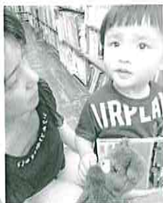
子どもたちには、クマさんがあいさつします!

※注 選挙の投票所として使用するため、7月9日(土)、10日(日)、30日(土)、31日(日)は臨時休館します。