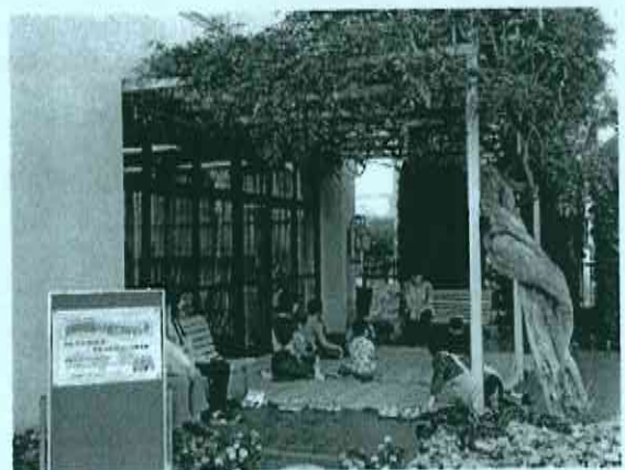
藤棚の下でのおはなし会

10月11日から11月17日までに行なった「図書館をよくするためのアンケート」について、全館で495人の方から回答を頂戴しました。現在集計中です。結果報告が整いましたら、図書館内や、ホームページなどでお知らせします。しばらくお待ちください。