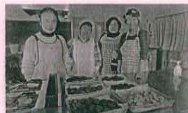
開館式典の特設カフェ用にコミセン調理室でクッキーづくり

開館後も、イベントやおはなし会のお手伝い、テラスの花壇のガーデニングチームなど、さまざまな活動が広がっています。