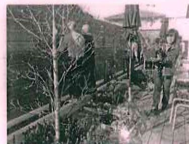
テラスの花壇に草花を植え込む作業