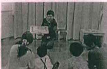
留学生による読み聞かせ

また、開館からの2週間は「まいにちおはなし会」としてサポーターやボランティアグループ、韓国・台湾などの留学生の協力によるおはなし会が開催されました。アジア、アフリカの絵本の展示も3月まで行われています。