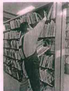
作業中の新米図書館員M

外で開館を待っていた利用者の方々が一斉に入館してきました。図書館って皆に必要とされているんですね。